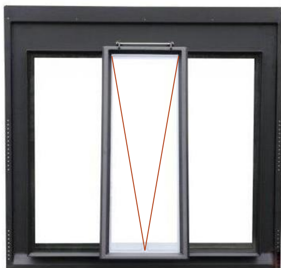
Châssis patrimoine Vitracier – Modèle DRG